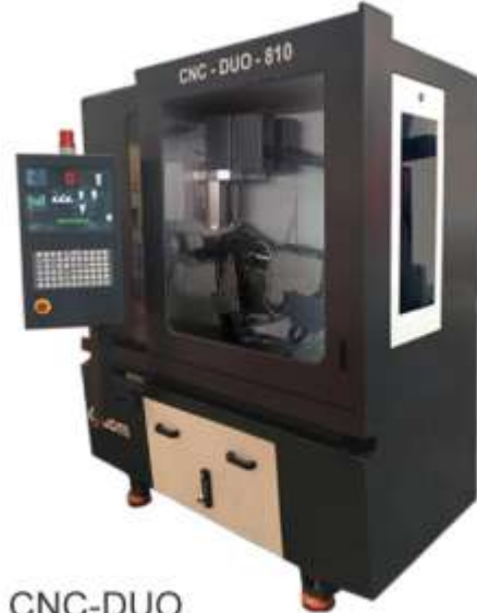
CNC-DUO CNC Otomatik TCT Daire Testere Yan Bileme Makinesi 7 Eksen Ful CNC Kontrol, Otomatik Açı Ayarı Daire Testere Çapı: Max:Ø125-600mm (Opsiyonel Ø800mm)