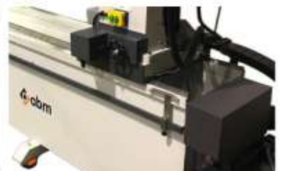
Opsiyonel Motor Kontrollü Talaş Verme (0,005mm)