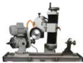
Opsiyonel Dairesel Bıçak Aparatı