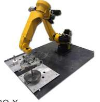
ROBO-X 6-Eksen Otomatik Yükleme Robotu