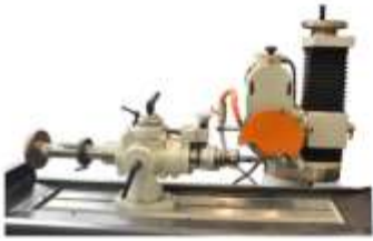
Opsiyonel Helis Aparatı