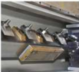
Standart T-Slotlu Mekanik Tabla