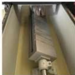
Opsiyonel Manyetik Tabla (Yan tarafta T-Slot sistemi ile)