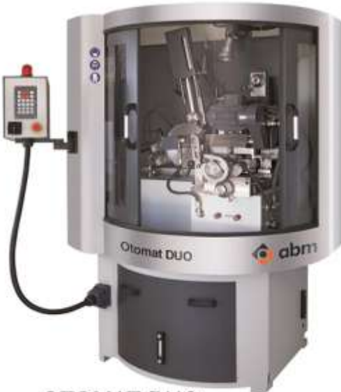
OTOMAT-DUO Hidrolik Otomatik TCT Daire Testere Çift Yan Bileme Makinesi Çift Yan Bileme, Hidrolik Kontrollü Daire Testere Çapı: Ø80-800mm