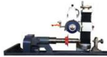
Opsiyonel Motorize Divizör Aparatı