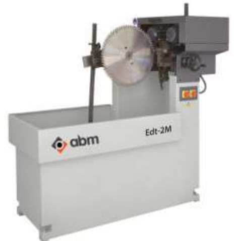
EDT-2M TCT Daire Testere Manuel Çift Yan Bileme Makinesi Güçlü CNC lineer kızak sistemi ile çift yan bileme Daire Testere Çapı: Ø80-600mm (Opsiyonel Ø800mm)