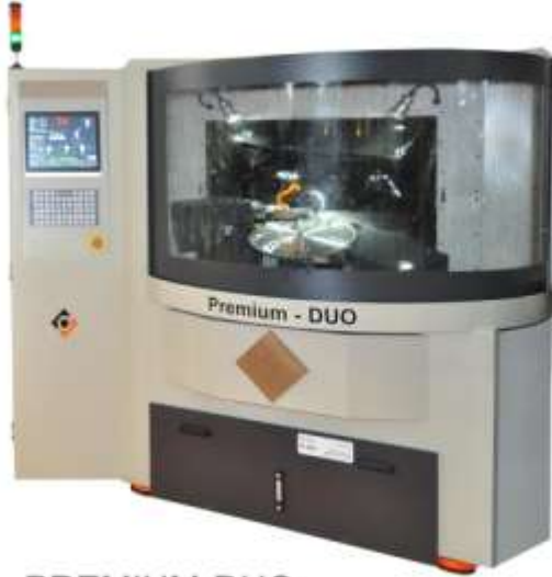
PREMIUM-DUO 8 Eksenli Çift Taşlı Tek Çevrimde Yan Bileme Makinesi 8 Eksen Servo Motor - PC Kontrol- Otomatik dış ölçme probu Daire Testere Çapı: Ø150-600mm (Opsiyonel Ø800mm)