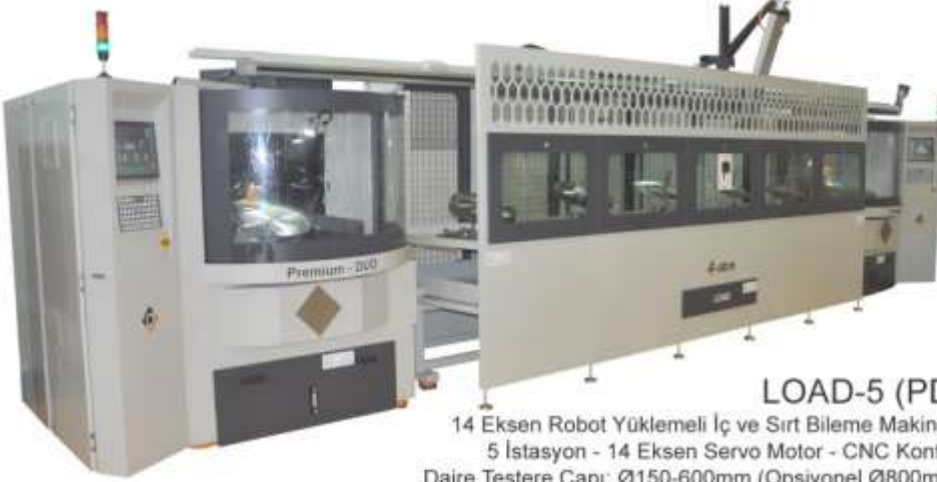
LOAD-5 (PD) 14 Eksen Robot Yüklü İç ve Sırt Bileme Makinesi 5 İstasyon - 14 Eksen Servo Motor - CNC Kontrol Daire Testere Çapı: Ø150-600mm (Opsiyonel Ø800mm)