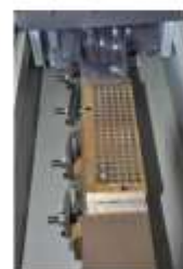
Takma Uçlar için Opsiyonel Manyetik Aparat