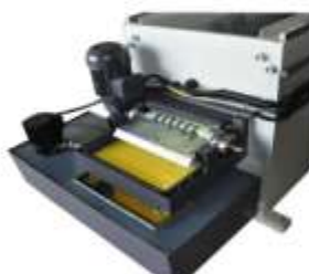
Opsiyonel Manyetik Seperatör